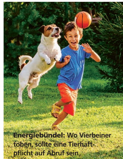
Energiebündel: Wo Vierbeiner toben, sollte eine Tierhaftpflicht auf Abruf sein

alphabetische Sortierung; Quelle: ServiceValue