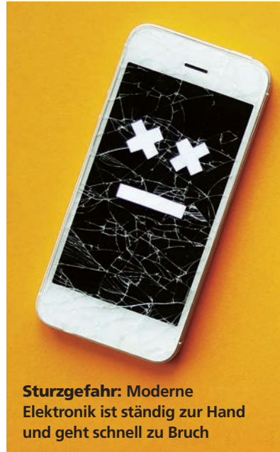
Sturzgefahr: Moderne Elektronik ist ständig zur Hand und geht schnell zu Bruch